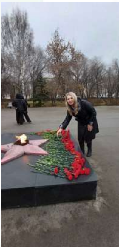
День Неизвестного Солдата в России