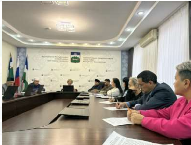
Заседание Комиссии по вопросам государственно-конфессиональных отношений и взаимодействия с религиозными объединениями при главе Администрации ГО г. Сибай.