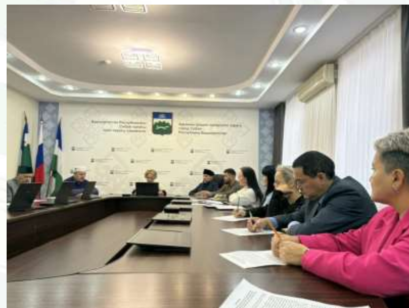
Заседание Комиссии по вопросам государственно-конфессиональных отношений и взаимодействия с религиозными объединениями при главе Администрации ГО г. Сибай.