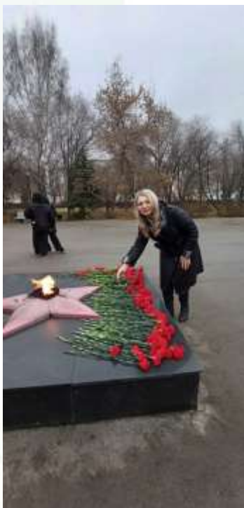
День Неизвестного Солдата в России